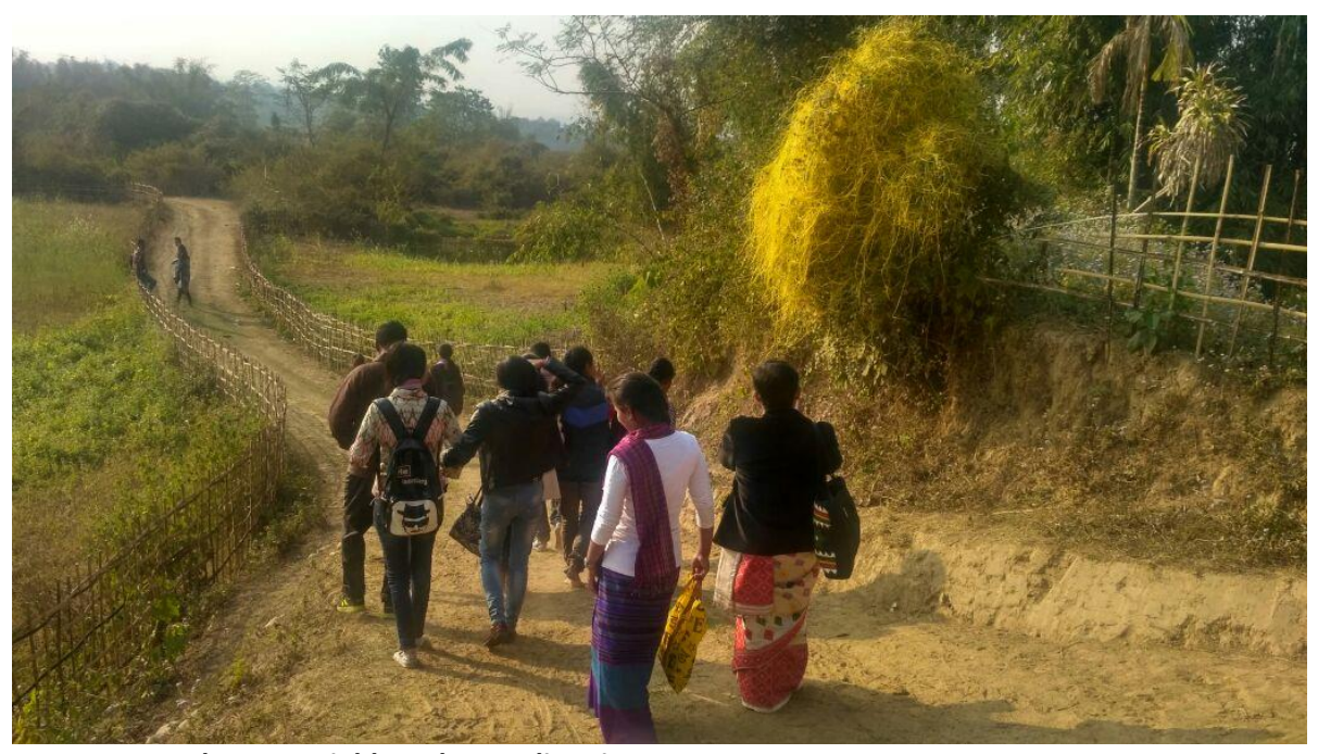
Students on Field Study at Kaliyoni